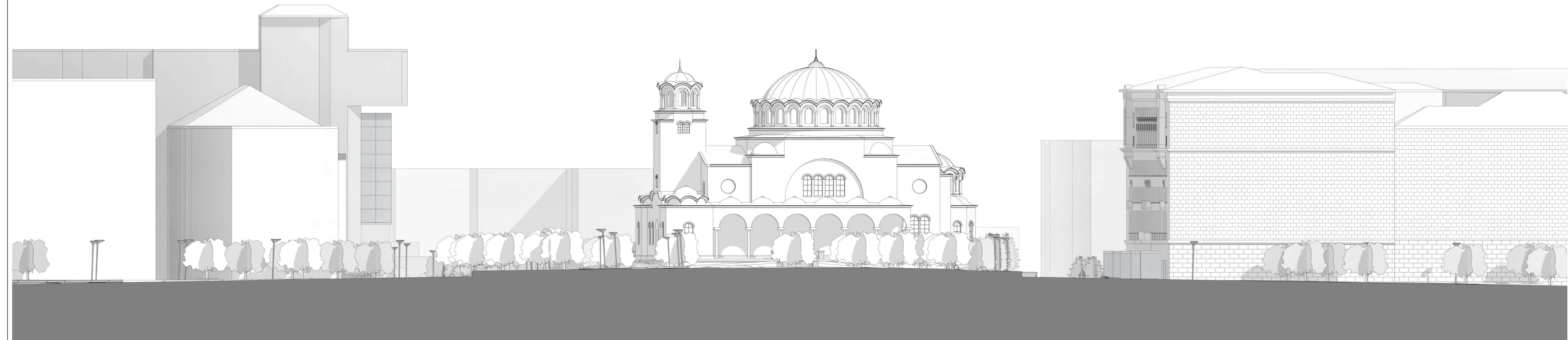
2 Section BB' 1 : 200