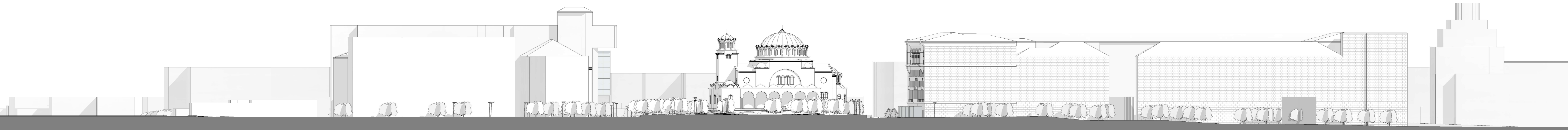
2 Section BB' 1 : 500