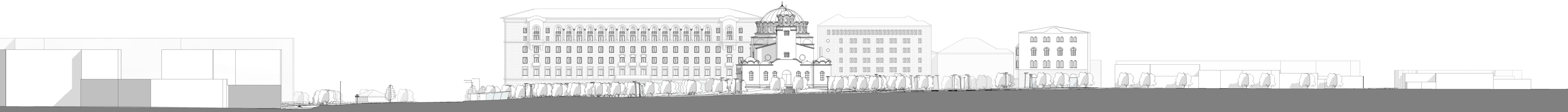
3 Section CC' 1 : 500