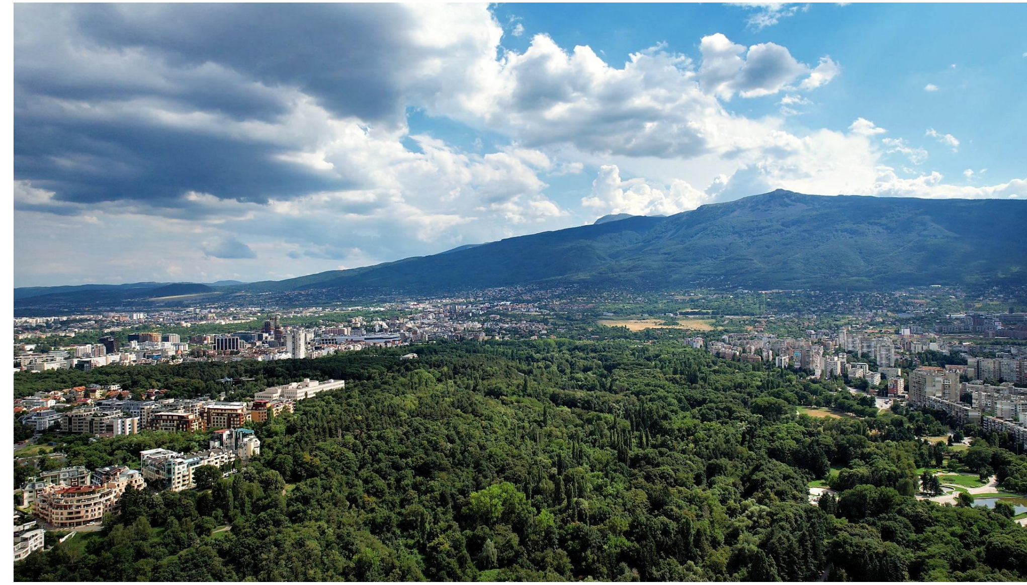
ИЗГЛЕД ОТ 150 м посока ВИТОША