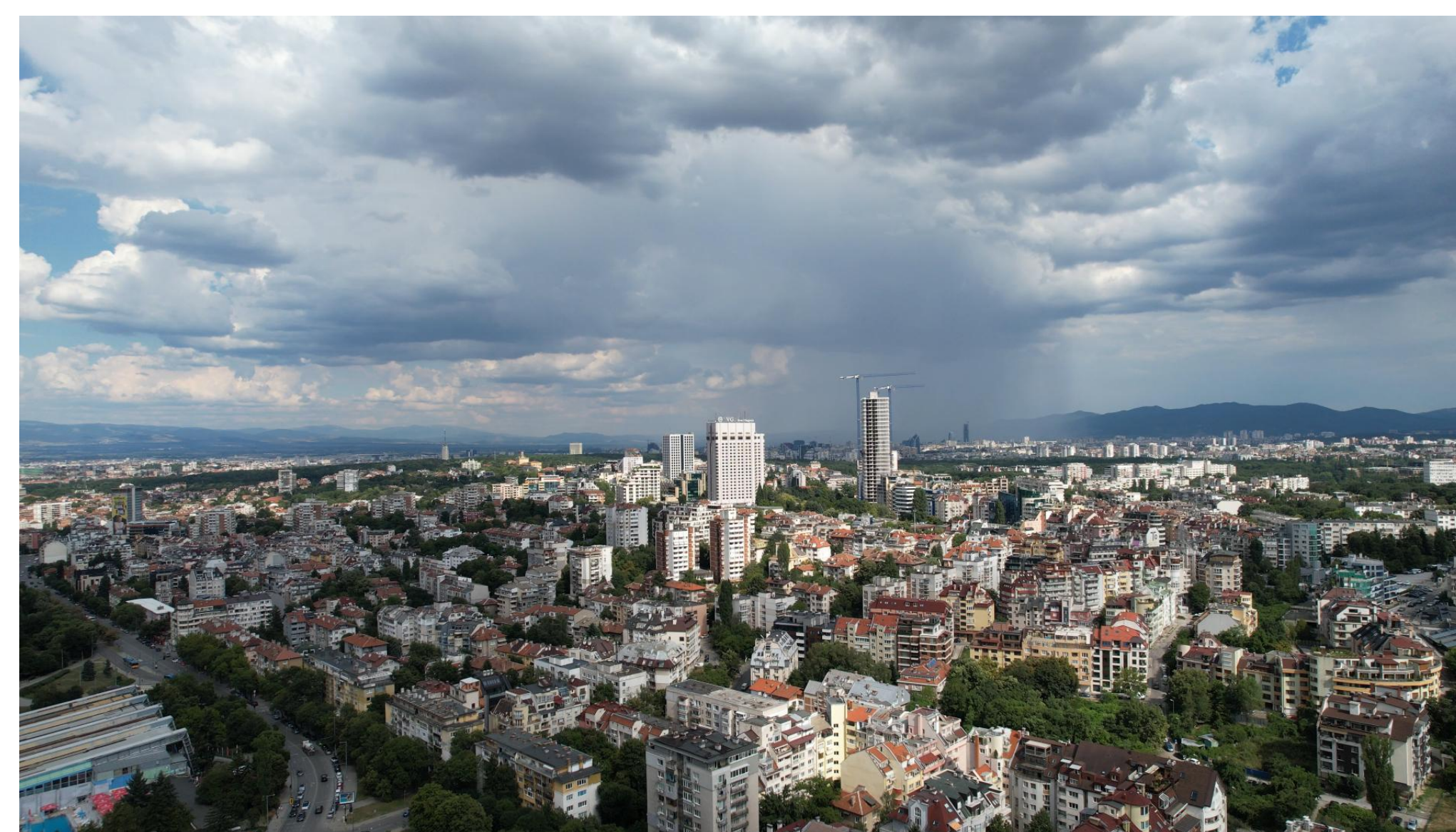
ИЗГЛЕД ОТ 150 м посока ТЕЛЕВИЗИОННА КУЛА